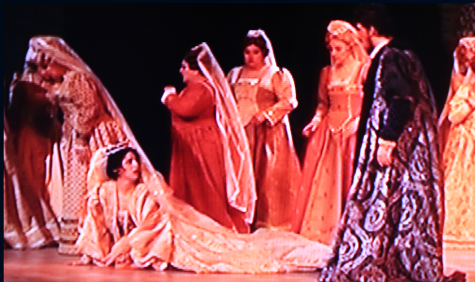
Una Scena tratta dall'Otello